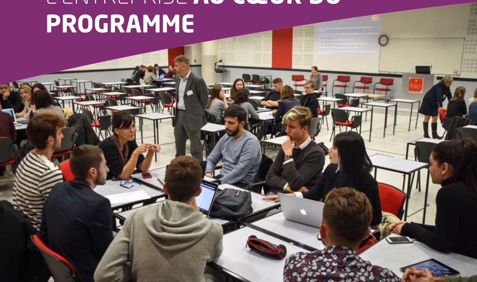
Atelier avec des représentants du Groupe Pasquier.

Les liens avec le monde de l'entreprise sont omniprésents dès le début du cursus et tout au long des 3 années d'études. Au-delà des cours animés par des professionnels, les étudiants assistent à des conférences-métiers, travaillent sur de nombreuses études de cas concrètes et participent à un Business Game.